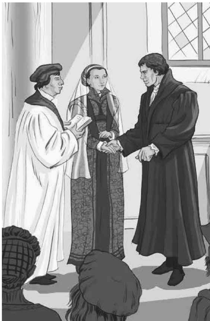
Casamento de Catarina e Lutero, em “Ecos do Martelo”

A revista Catarina von Bora – a Reforma em Quadrinhos foi lançada durante o Encontro Nacional “Mulheres Luteranas Celebrando os 500 anos da Reforma”, ocorrido em Foz do Iguaçu/PR de 17 a 19 de março último. É uma revista de 16 páginas que faz um breve relato da vida de Catarina, passando pelos seus principais pontos (exceto sua morte, pois ela é a narradora da história). A publi-